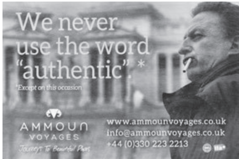
13 »We never use the word authentic«. Anzeige, London Review of Books , September 2016

deutsch: Fülle. »We never use the word authentic«, verkündet die Anzeige des britischen Reisebüros, das in der London Review of Books für Urlaub in Griechenland und der Türkei für ein gebildetes akademisches Publikum wirbt. »Authentic« ist mit einem Sternchen versehen; darunter, kleiner gedruckt und augenzwinkernd: »Except on this occasion.«