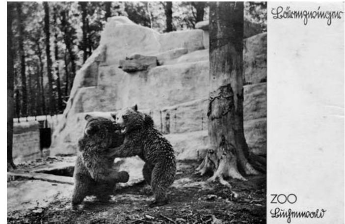
Die Bären von Buchenwald. Ansichtskarten wie diese vertrieb die SS auch im nahen Weimar.